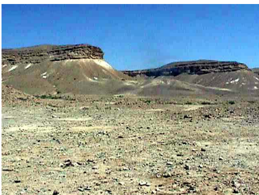
מראה כללי של הר כרכום

ממצאים רבים לרגלי ההר מעידים על כך: מצבות, במות, מקדשים, קברים וכמות אדירה של ציורי סלע כ 40,000. כל זה מעיד על פעילות דתית ענפה לאורך זמן רב המאשר את החשיבות הפולחנית של המקום.