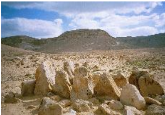
אתר 12 המצבות לרגלי הר כרכום ברקע