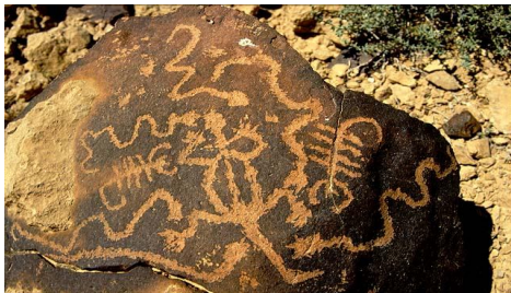
חרדון עקרבים ונחשים