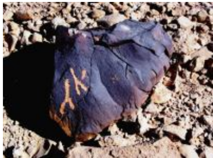
יהה -- שם אלוהים חרוט בסלע

חרדון ונחשים המתארים את תלאות יציאת מצריים ועוד. כל אלה, לפי ענתי, מחזקים את ההשערה שהר כרכום הוא הר סיני. דברים פרק ח: (יד) ורם לבבך ושכחת את ה' אלהיך המוציאך מארץ מצרים מבית עבדים: (טו) המוליך במדבר הגדול והנורא נחש שרף ועקרב וצמאון אשר אין מים המוציא לך מים מצור החלמיש: (טז) המאכילך מן במדבר אשר לא ידעון אבותיך למען ענתך ולמען נסתך להיטבך באחריתך: