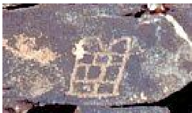
אידיום לעשרת הדברות

המכלול הגדול ביותר של ציורי סלע המוכר בנגב ובסיני שזמנו החל מלפני כ 10,000 שנה ועד לעת המודרנית נמצאו בהר כרכום. ציורי סלע כאלו מתארים סצנות מחיי היום עם חזרה על נושא מבויס המחזק את הלך המחשבה והרעיונות של התקופה. זה כולל מחזות ציד בקשות ותפילות לישויות עליונות בתחינה ובבקשה אולי ל: לציד טוב, להרבה גשם וכמובן בקשה לפיריון הכל בדומה לצרכים ורצונות שלנו כיום. חלק מציורי הסלע בהר מזכירים או משחזרים מעמד המתואר בתנ"ך המרמז על הופעת אמונה חדשה באזור. חלק רומז על פירוש פסוקים במקרא ולפי פרופ' ענתי אלה מאוששים שיציאת מצריים חרתה גם כן את חותמתה. לפניכם מספר דוגמאות של ציורי סלע כגון: