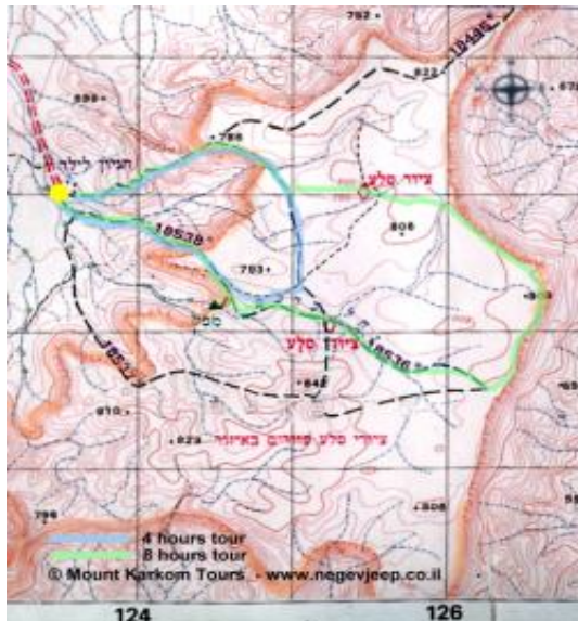
מפת הר כרכום

ממצפה רמון כביש סעו 171 להר חריף לכביש מספר 10, מובילה אל דרך הגישה אל ההר. ממשיכים בשביל העפר המסומן אדום ומתפתלים עימו בסבלנות כ 12 ק"מ עד לחניון של הר כרכום. המעבר בשטח הוא קל אך מצריך רכב 4X4. ההר מצוי בתחום שטח אש של צה"ל. יש צורך בתיאום מוקדם עם הצבא. הגוף האחראי לכך נקרא "מתא"מ דרום" וניתן ליצור איתו קשר באמצעות הטלפונים: 08-9902926, 08-9902230, או פקס: 08-9902511.