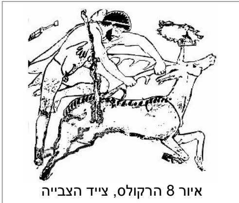
איור 8 הרקולס, צייד הצבייה

כדוגמא במיתוס, הרקולס וצייד הצבייה עם קרני הזהב, אחת המטלות של הרקולס. המיתוס מספר: מלך אוריסתאוס ציווה על הרקולס לתפוס ולהביא אליו את הצבייה בעלת קרני הזהב ששוטטה בקיריניאה שבארקדיה. הרקולס לא רצה