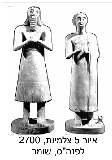
איור 5 צלמיות, 2700 לפנה"ס, שומר

מטבע הדברים נסתרות הן דרכי האל ולמרות זאת כולם מתאמצים לפצח את חידתם. ללא יכולת להסביר את המתרחש בעולם הרבה תרבויות פנו לשמיים. האדם דאג לא רק ליום-יום, אלא הוא רצה להבין ולהשפיע על מקומו ביקום על ידי ריצוי כוחות נעלמים. הקדמונים האמינו כי לכל מה שרואים על הארץ יש מקבילה בעולם השמימי, והיא עשירה ועמידה יותר, והיא גם נצחית! מתוקף האמונה שגרמי שמים מייצגים אלים הצופים במעשי האדם הפכו תצפיות הכוכבים לדת. הקדמונים עקבו אחריהם בדריכות כדי לנסות ולצפות את העתיד. התנועות המחזוריות של השמש והירח והכוכבים גרמו לפריחה של האסטרוולוגיה שייחסה את תאריך הולדת האדם כזמן קביעת גורלו.