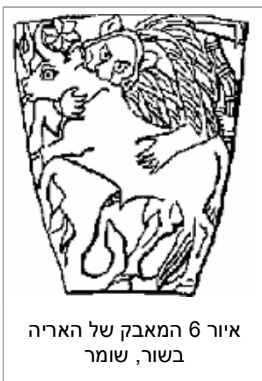
איור 6 המאבק של האריה בשור, שומר

הקדמונים מיפו את השמיים בעונות השונות של השנה והשתמשו בהם לחיזוי אירועים שמימיים שעלולים להשפיע על חייהם. בתקופה בה התחילה החקלאות ועבודת האדמה, הכוכבים היו השראה אלוהית והיוו מקור לא אכזב לזיהוי עונות והזמן. ניתן לראות זאת בציורי שמיים בתרבויות שונות בעולם. ציורי שמיים מוגדרים כאן כציורים בהשראת מראה השמיים, כמו ציור הקונסטלציות ממצריים. הקונסטלציות הופכות לדמות דמיונית ויחד הן יוצרות סיפור או ציור שלם המתאר התרחשות שמימית כמו חילופי העונות למשל. נראה שציורים מסוג זה מקורם משומר בגלל בקיאותם בשמיים ושם לראשונה מתגבש רעיון הקונסטלציות. הציור עצמו מורכב מסמלים ובכדי לפענחו ודרושה הכרות טובה