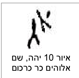
איור 10 יהה, שם אלוהים כר כרכום

הכתב הוא דרך ביטוי ותקשורת בין אנשים הוא החל מהציור ועם הזמן התפתח לצורה של ביטוי כמו הדיבור. בעולם הקדום הכתב נחשב שהוא נושא עמו מסר קדוש ולכן כאשר שמו של אלוהים נכתב היה זה סימן שאיזכורו הבטיח את מילוי הבקשה. במסורת המסופוטמית כתוב שהוא הומצא בגלל שהשליח של מלך שומר היה כבד לשון. ואכן רואים בלוחות שבתכתובת דיפלומטית השתמשו בכתב.