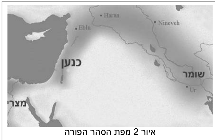
איור 2 מפת הסהר הפורה

בסהר הפורה, כ-4,000 שנה לפנה"ס, התהוו מעצמות העל של העולם הקדום, במיוחד תרבויות מצרים ושומר. שמו של הסהר הפורה בא לו מצורתו, חצי ירח, והוא משתרע בין הנהרות פרת וחידקל במסופוטמיה ולאורך הנילוס במצרים. הודות לתנאים הנוחים, שטחי חקלאות וריבוי