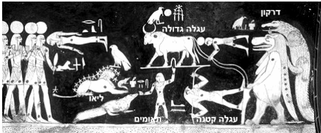
איור 3 ציור הקונסטלציות סביב כוכב הצפון, קבר פרעה סטי 1300 לפנה"ס

במהלך קוסמי... הנפשות של המתים מקוות להצטרף אל כוכבי האל מוות". בקברי פרעה צוירו בתקרה הקונסטלציות סביב כוכב הצפון, שנקראו כוכבי האלמוות, הכוללות את קונסטלציית ההיפופוטם בהריון, עם התנין מאחוריה, המחזיק בחבל הקשור לרגלו של השור שהוא ציר העולם. לפי האמונה ההיפופוטם בציור, הנמצא בהריון, היא אלה שמימית אשר בולעת את השמש במהלכה בשביל החלב. כך נראו השמיים למצרים.