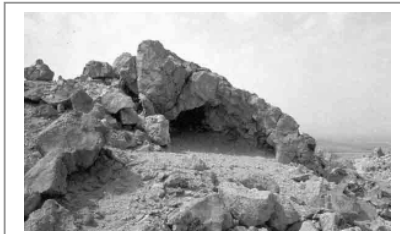
איור 4 הנקרה

בראש ההר, בגובה של למעלה מ-842 מ' מעל פני הים, קיימת בהר מערה לא טבעית, מעשה ידי אדם, ענתי מכנה אותה "הנקרה". במקרא מופיע תיאור המקום שמשה שוהה בהר, 40 יום ולילה, ושם הוא מקבל מאלוהים את עשרת הדברות: (שמות ל"ג, כא-כב). "ויאמר ה' הנה מקום