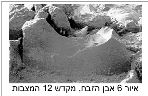
איור 6 אבן הזבח, מקדש 12 המצבות

כל הסמנים האמורים, קרי צורת המקדש, מספר המצבות, עיצוב השטח וחלוקתו, ההפרדה בין שני החלקים, מעידים על רוח של אמונה חדשה. ענתי רואה באתר 12 המצבות את המימוש האחד והיחיד למסופר בחומש למזבח שמשה בונה, (שמות כד 4), ויכתוב משה את כל דברי יהוה וישכם בבקר ויבן מזבח תחת ההר ושתיים עשרה מצבה לשנים עשר שבטי ישראל. בפסוק הבא בסיפור של הקמת המזבח, מופיע תיאור טקס הקרבן, (שמות כד) ה וישלח את-נערי בני ישראל ויעלו עולות, ויזבחו זבחים שלמים ליהוה פרים. ו ויקח משה חצי הדם וישם באגנות וחצי הדם זרק על-המזבח. ז ויקח ספר הברית ויקרא באוזני העם ויאמרו, כל אשר-דיבר יהוה נעשה ונשמע. ח ויקח משה את-הדם ויזרוק על-העם ויאמר, הנה דם-הברית אשר כרת יהוה עמכם על כל-הדברים האלה.