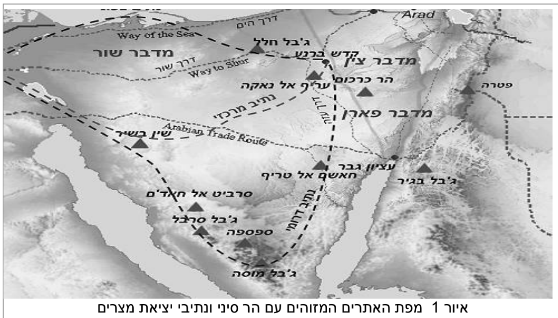
איור 1 מפת האתרים המזוהים עם הר סיני ונתיבי יציאת מצרים

הנתיב המרכזי: גרסה המצביעה על ג'בל סין-בישר, במערב חצי-האי, כאתר הר-סיני, הר כרכום.