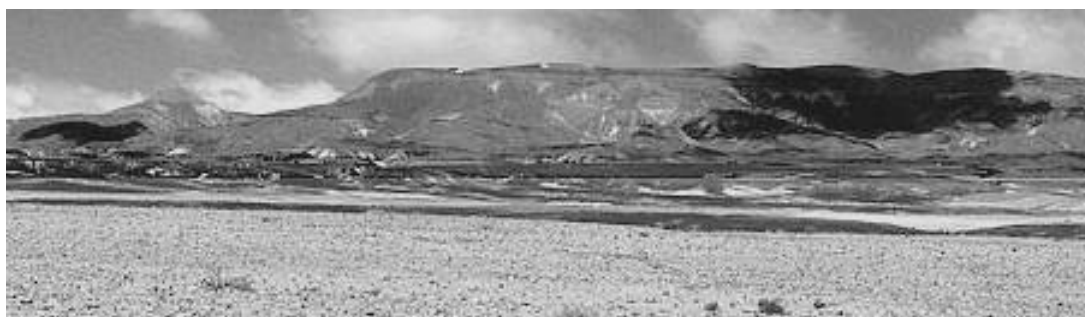
איור 2 הר כרכום, מבט ממישורי פארן לכיוון מערב. שימו לב לדימוי הקרנף בקצה השמאלי

הר כרכום, נמצא בנגב התיכון, הוא נצפה ממרחק רב, מדרום, ממערב וממזרח. ההר בולט במרחב, וניתן לצפות בו מהרי אדום, מהרי ירדן, מההרים במרכז סיני ואפילו ממכתש רמון בצפון. דמות הקרנף שלו עם החוד בקצהו נשקפת ממערב וממזרח, ואין ספק שהוא שימש תמרור לנוודי המדבר במשך אלפי שנים בחצותם את המדבר.